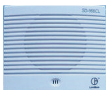
门禁考勤语音播放模块