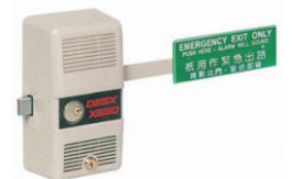
消防通道锁(带报警)