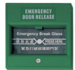
紧急碎玻逃生开关