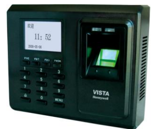
CA-FP-100FS CA-FP-100FID CA-FP-100FIC